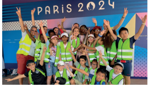
Une journée à Roland-Garros