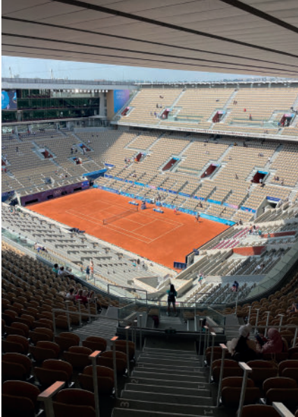
Une journée à Roland-Garros