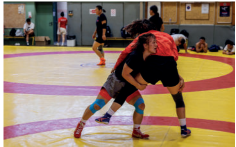
Accueil des lutteurs Mongols