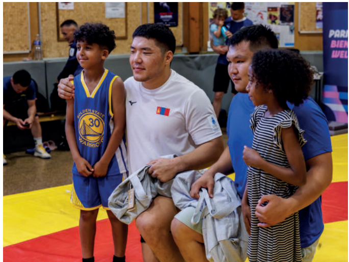
Accueil des lutteurs Mongols

Retrouvez les sorties aux Jeux paralympiques de tennis de table et d'athlétisme les 29 et 30 août.